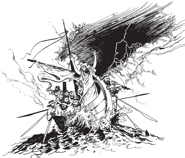
Yeesua gwæla n ham n nyaalm

«¿Ben nid nii wunwii, na l'lag n ham n nyaalm mehñ valgm wii?»