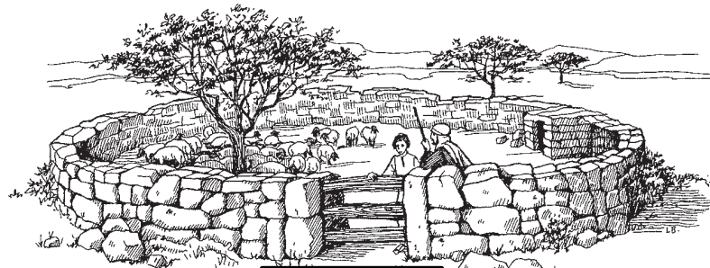
Yuudaa tiiba kodiir

10 1 «Mà bɔhɔɔ-n gobiint na waa: «Ka hii ba jib n fei kodiir noor, n ka kota dabid na hà jib n kaalanjeenga, wiilaf ba na bawdn, ka ta ba na nidkuudn. 2 Há jiba n kodiir fiid noor wii, wii nnii fɛskimta. 3 Há kiig kodiir hɛn wii ba hà rawdg-wu, fei hom há noor. Hà hohf han hef hii volgu n kú hidr, volgu n kú hidr ka rea-fi. 4 Han